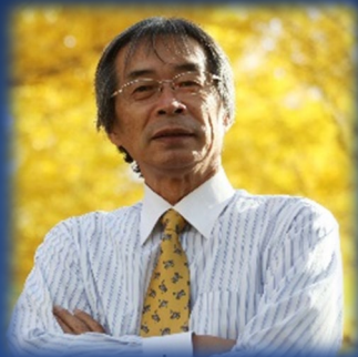
会長 北海道大学 名誉教授

通常総会・記念講演会・交流会 講演会・セミナー（3～4回） ICTサロン（2～3回） 調査検討会（ニーズに応じて） 視察会（ニーズに応じて）